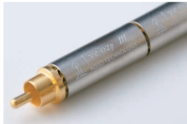
(参考1)増設・拡張するve-02pシリーズ