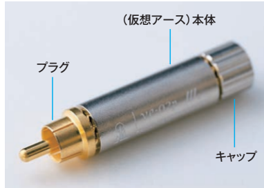
3ピース構成のve-02pシリーズ

無駄がなく幅広く利用可能なve-02pシリーズは、これからの時代にマッチしたサスティナブル製品と言えます。