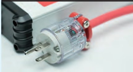
医療施設用プラグ / コンセント仕様