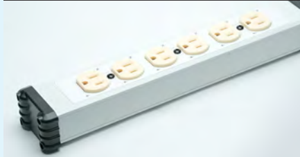
3芯コンセント × 6口