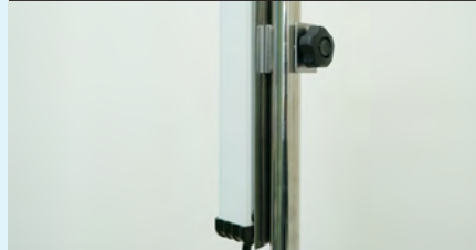
専用金具で IV ポールに取り付けて使用